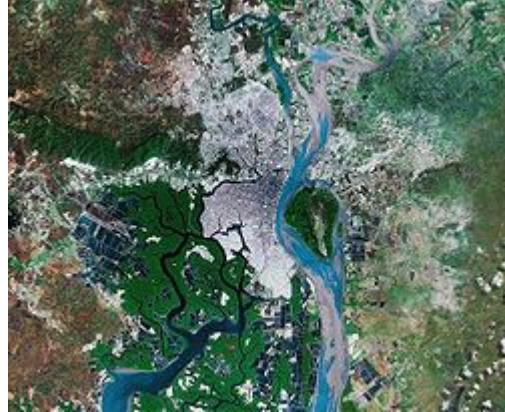
Imagen satelital de la ciudad de Guayaquil y el río Guayas.