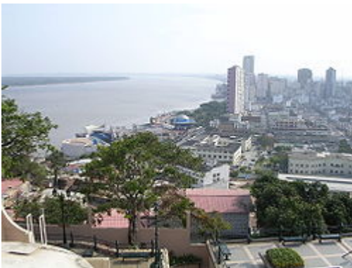
Imagen del río Guayas a su paso por Guayaquil, desde el Cerro Santa Ana.

La región donde se ubica Guayaquil tiene suelos muy fértiles que permiten una abundante y variada producción agrícola y ganadera. Se cultiva algodón, oleaginosas, caña de azúcar, arroz, banano, cacao y café y frutas tropicales como el mango, maracuyá (primeros exportadores mundiales), papaya, melones y muchas más. También se exportan flores y plantas tropicales del río Guayas, así como el bosque seco tropical de Cerro Blanco, la presa de Chongón con su gran lago artificial y Puerto Hondo con los manglares y brazos de mar navegables.