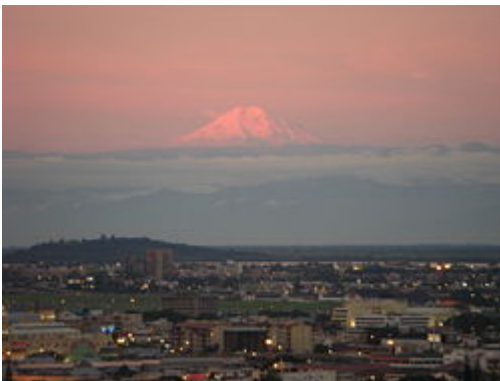
Volcán Chimborazo visto desde la ciudad de Guayaquil, esto se puede apreciar raramente

Guayaquil está situada en la cuenca baja del río Guayas, que nace en las estribaciones de la Cordillera de los Andes y desemboca en el Golfo de Guayaquil, en el Océano Pacífico. El río Guayas está formado por los ríos Daule y Babahoyo . La cuenca del Guayas es la más grande de la vertiente del Pacífico, con 40 000 km 2 y una extensa área de la costa ecuatoriana bañada por el río del mismo nombre y toda su red de afluentes.